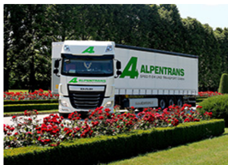
Unsere neuen EURO 6 Stars im Fotoshooting http://www.wildenhofer.at